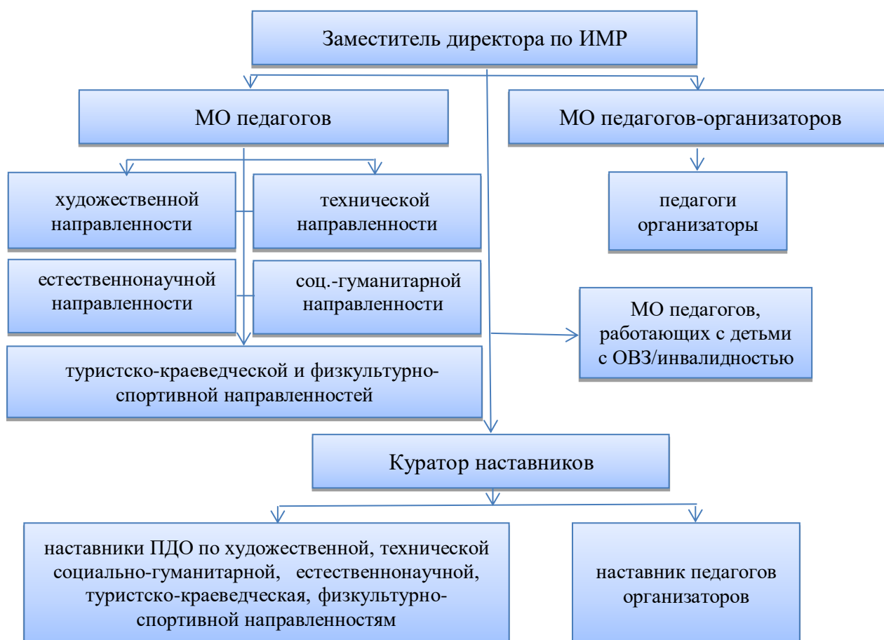
Схема 1. Механизм управления методической деятельностью образовательной организации

В профессиональном становлении педагогов задействован весь педагогический коллектив, но основная деятельность осуществляется через работу методических объединений, индивидуальную работу наставников и самообразование (схема 1).